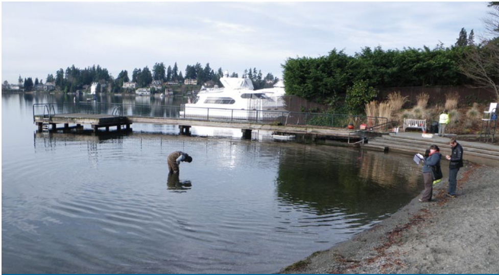
Un trabajador de servicios públicos revisa la línea del lago.

Los residentes pueden aportar ideas para el plan de gestión