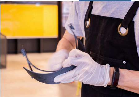
Các doanh nghiệp cho đi