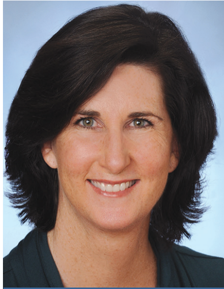
Tác giả: Thị Trưởng Lynne Robinson

thần cộng đồng, cộng tác và hy vọng. Cuộc chiến đã gần đến hồi kết, nhưng chúng ta phải tiếp tục tuân thủ hướng dẫn của thống đốc để cán đích thành công.