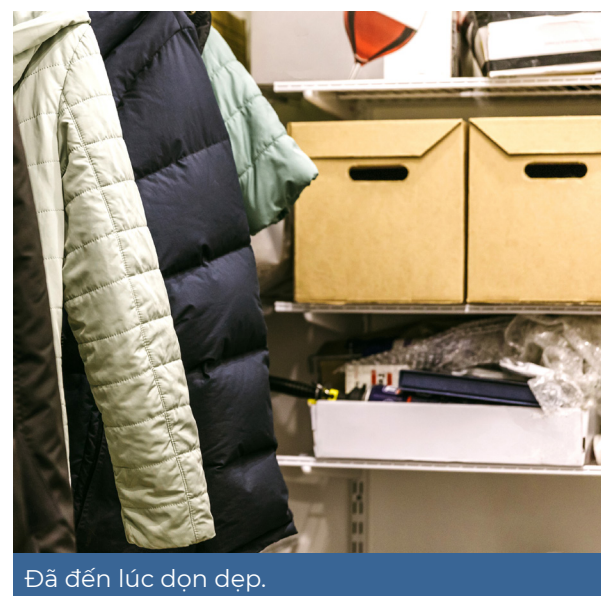
Đã đến lúc dọn dẹp.

Tất cả các khách hàng sử dụng điểm bỏ rác đều phải hạn chế số lần đến bỏ rác và thực hiện giữ khoảng cách an toàn. Nếu quý vị có bất kỳ câu hỏi nào về thông tin này, hãy liên hệ với Sở Dịch Vụ Tiện Ích Bellevue (Bellevue Utilities) theo số recycle@bellevuewa.gov .