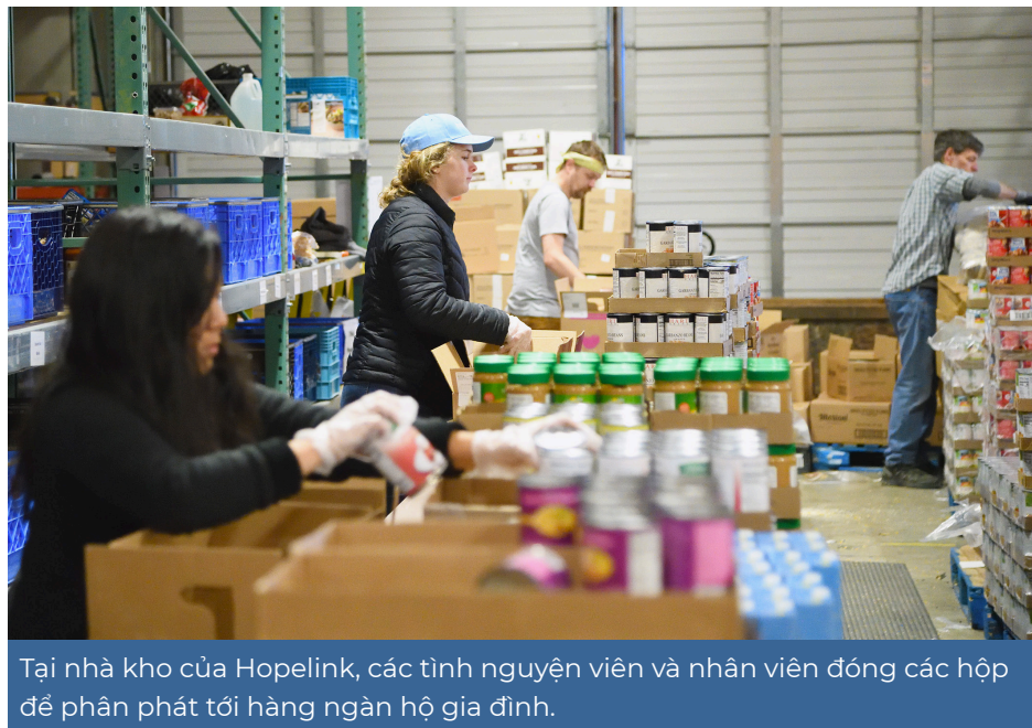
Tại nhà kho của Hopelink, các tình nguyện viên và nhân viên đóng các hộp để phân phát tới hàng ngàn hộ gia đình.

Tác giả: Alex O'Reilly, Giám Đốc Nhân Sự