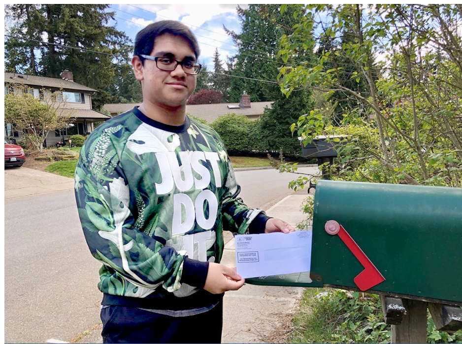
Giống như một cư dân nhỏ tuổi sẽ nói về việc điền bản điều tra dân số, "Làm thôi".

Trên khắp cả nước, các thành phố đang ước tính xem có bao nhiêu người có nguy cơ do đại dịch vi-rút corona, về tài chính hoặc y tế. Số liệu ước tính chính xác sẽ cho phép các thành phố có được những nguồn lực cần thiết và lên kế hoạch hiệu quả để phục hồi.