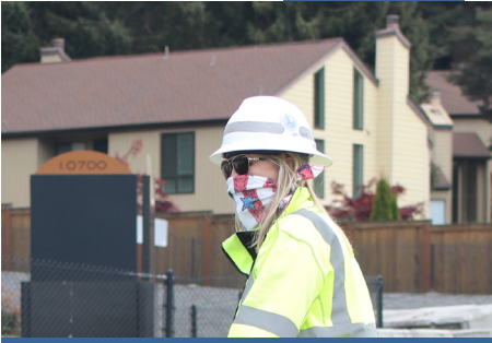
Nhân viên hiện trường thích ứng với hoàn cảnh