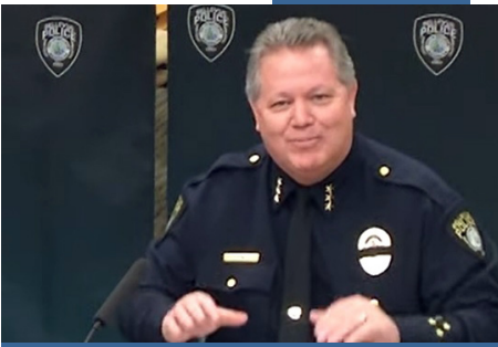
Cảnh sát trưởng trò chuyện với cộng đồng người gốc Á

PRSR STD U.S. Postage PAID Bellevue, WA Permit No. 61